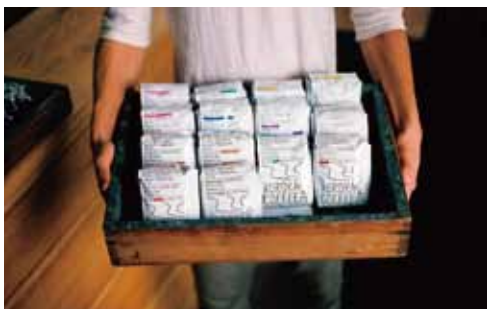
AURORA COFFEE

金属工芸作家、おやつ研究者。1983年岐阜県生まれ。東京芸術大学大学院修了。学生時代から金工技術を使ってお菓子の道具の作品などを制作し、オリジナルのお菓子の研究をする。2012年に山形県に移住。焼き印やカトラリーなど、金属の作品作りを本業として、「カワチ製菓」としてお菓子の小売り販売もするようになり、各地のお店への発送やイベント参加などで活動中。山形市在住。