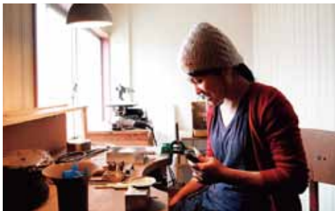
AYAKA KAWACHI